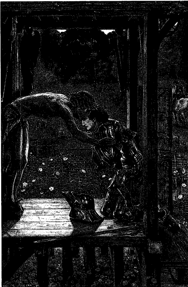
図1 「慈悲深い騎士」1863年。その主題は1039年にヴァロムプロサン教団の創設した人物で、親類の殺害を許してから路傍の祠堂で祈っていて奇跡的に木製のキリスト像から抱擁を受けたフィレンツェの騎士サン・ジョヴァンニ・ギルベルトの物語りに取材したものである。これはバーン=ジョーンズの好きな初期作品であった。

規模だが忠実な一団（主にロセッティとラスキンに紹介された）のお陰で1860年代を通して活動が続けられた。リーズのトーマス・プリントはバーン=ジョーンズの数多くのペンとインクの素描だけでなく、少なくとも「蠟の像」（1856）「賢い乙女と愚かな乙女」（1859）と「至福の乙女」（1860）「シドニア・フォン・ボルク」の小さいな版（1860）と「ロザモンドと王妃エレアノール」（1861）の5点を含めた絵画と「東方の三賢人の礼拝」の3連作も所有していたが、プリントはその最後の作品をバーン=ジョーンズが仕上げる前の1861年にあいにく亡くなった。彼の死はラファエル前派の仲間たちに多くの当惑を引き起こし