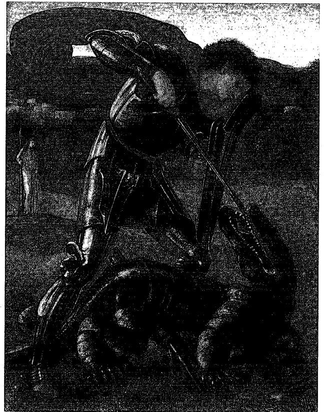
図4 「竜と戦う聖ゲオルギウス」。バーケット・フォスターに製作依頼された素描の連作の1例。この主題のグワッシュ水彩画もあり、ウォルサムストウのウィリアム・モリス・ギャラリーにあるのは日付けが1868年になっている。両方とも「戦い」の異形、すなわちその連作の6番目のエピソードである。

た。というのもプリントは多数の芸術家に大きな額の前金を払ってしまっていて、作品をまったく受け取ってなかったのである。指定遺言執行人はこれらの絵画が仕上げられることを要求し、代理人の中心業者としてアーネスト・ガンバートが指定された。ガンバートはラファエル前派芸術家に不人気になり、ロセッティなどは下絵の一枚にガンバートをユダとして描いたりした。プリント以外の初期の重要なパトロン（出資者）はニューカースルのジェームス・リートハートで、彼は「麗しのロザモンドと王妃エレアノール」（1860）、「マーリンとニミュー」（1861）、「慈悲深い騎士」（1863）、「シドニア・フォン・ボルク」と「クララ・フォン・ボルク」（共に1860）、それに「ヴァレンタインの朝」（1863）の6点の初期の水彩画