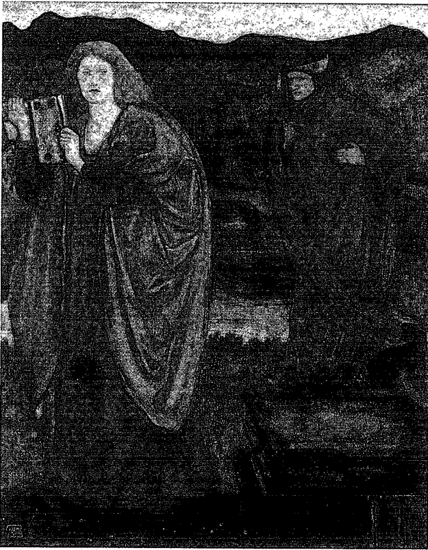
図3 「マーリンとニミュー（湖の麗人）」。1861年。マロリーによると、ニミューはペリノア王によってカメロットにあるアーサー王の宮廷に連れてこられた「湖の麗人」であった。マーリンは彼女を「溺愛し」、彼は彼女にコーンウォールについて行って石に閉じ込められた。バーン＝ジョーンズの好きな主題で、その異作を何点か制作している。