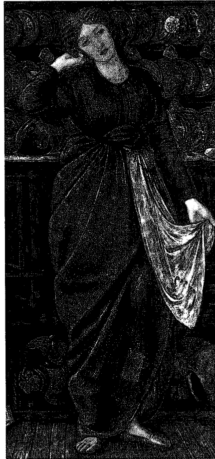
図2 「シンデレラ」。1864年にオールド・ウォーターカラー・ソサイエティで展示されたグワッシュ（水彩）で、ここでは「麗しのロザモンド」への補足作品として掛けられた。両方とも強烈な色彩で賞讃された。ドレッサー（棚と引出しのあるキャビネット）の上の青と白の皿が1860年代にロセッティとホイッスラーによって始められた東洋磁器収集の趣味を反映している。